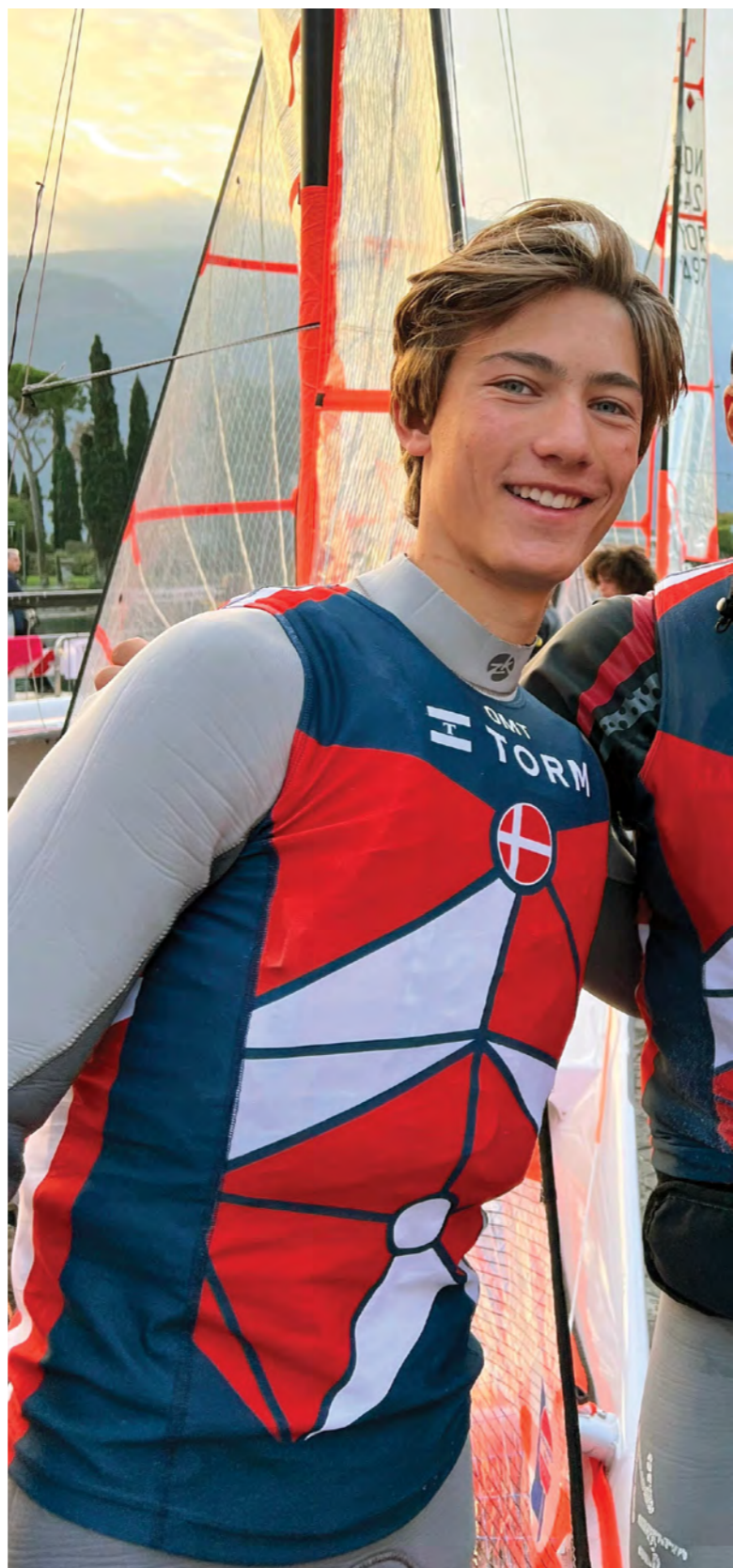
Til Eurocup finale i Italien, oktober 2022.

På Helsingør Eliteidræts Akademi (HEA) kan jeg kombinere min skolegang og mit sportsliv. Jeg bruger rigtig meget tid på min sport. Der er den almindelige træning med 4 ugentlige træningspas, samt de mange nationale og internationale stævner, som skal gå op i en højere helhed med skolegangen og det sociale. Alt dette