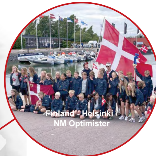
Finland - Helsinki / NM Optimister