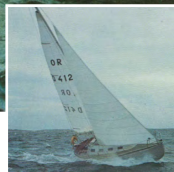
Grinden - havets Volvo "herregårdsvogn".