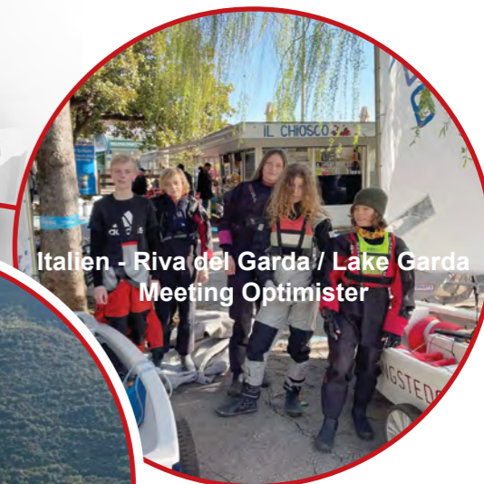
Italien - Riva del Garda / Lake Garda Meeting Optimister