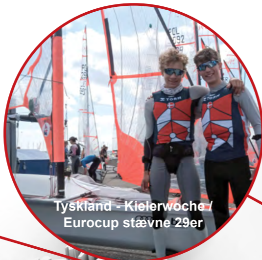
Tyskland - Kielerwoche / Eurocup stævne 29er