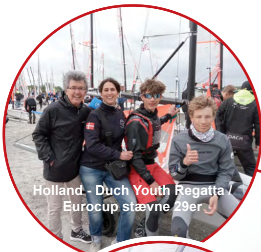
Holland - Duch Youth Regatta / Eurocup stævne 29er

I 2022 har flere sejlere fra Snekkersten end nogensinde sejlet rundt omkring i hele Europa. Se her et lille udsnit af store øjeblikke!