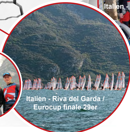
Italien - Riva del Garda / Eurocup finale 29er

Løsning på bagsidens juligave-quiz: 1 Paraplyanker 2 Trailerspil 3 Padel 4 Fagaf 5 Lanterne styrbord 6 Aregaffel aluminium 7 M-anker 9 Drivaner 10 Nøglesjækel med spiltpind 11 Lanterne bagbord 12 D-sjækel med captive pind 13 Ankerspill 14 Danfort anker 15 Aregaffel galvaniseret.