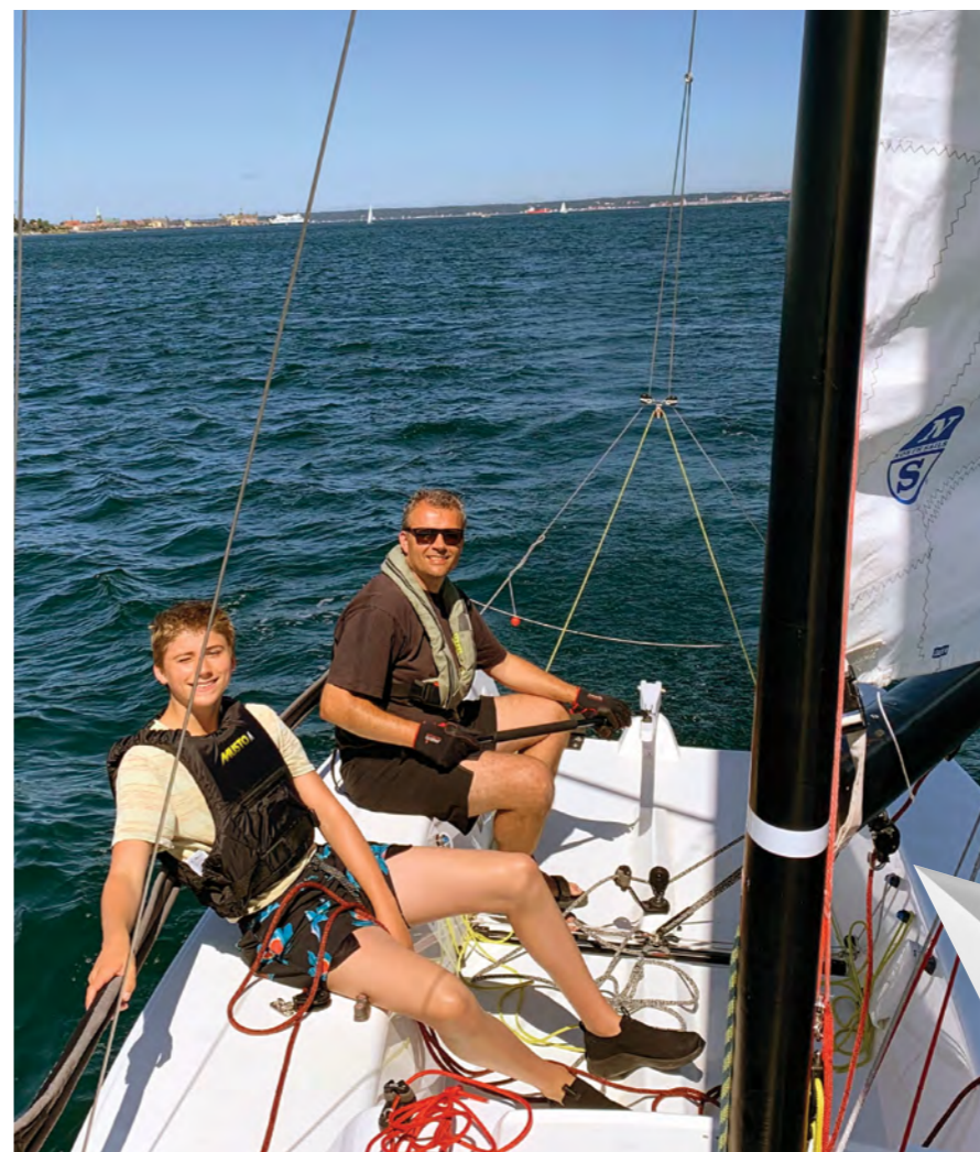
Prøvetur i J70.

Efter første sæson fik vi også lyst til at prøve kræfter med kapsejlads. Torben og jeg er begge aktive forældre