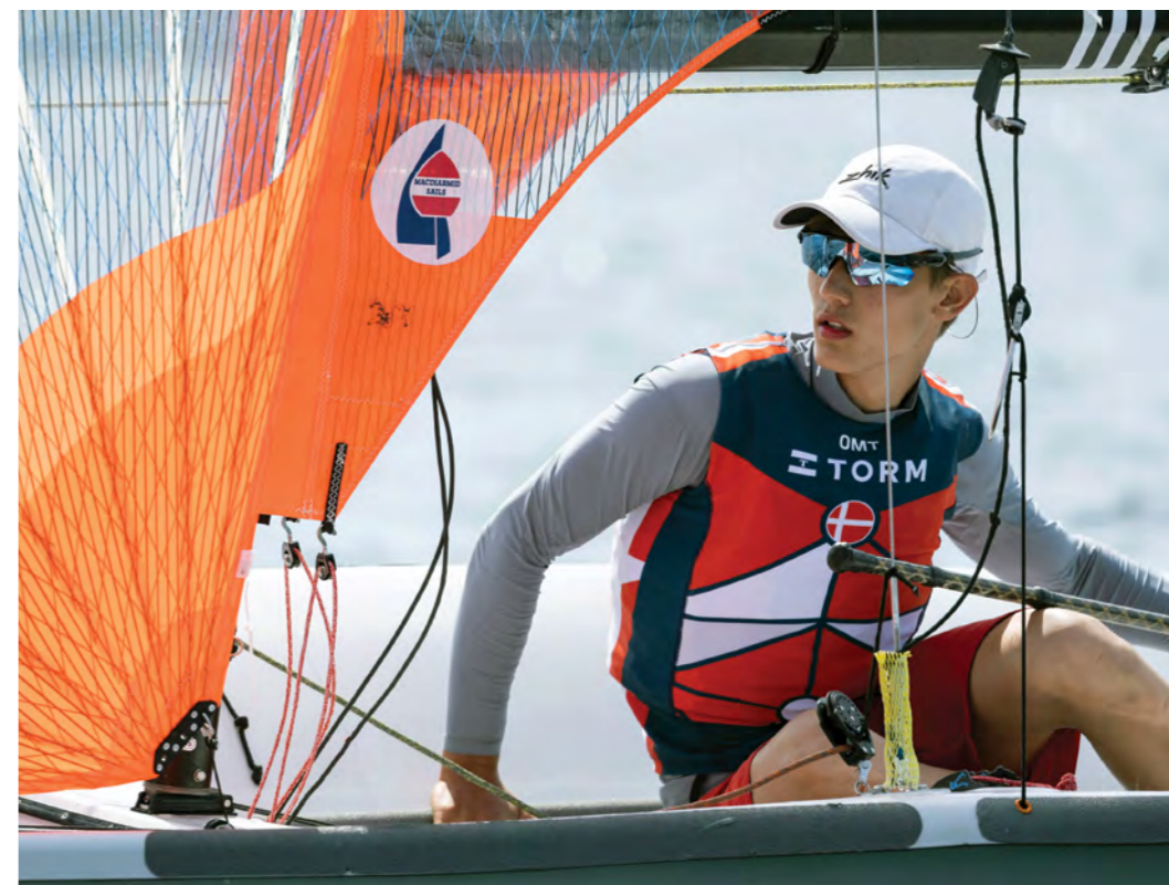
Til VM i Spanien August 2022.

sammenlagt giver et maks tidspresst skema. Som HEA-elev er skemaet tilrettelagt, så jeg kan træne om morgenen to gange om ugen, men når jeg er af sted til stævner, kræver det en del at holde skolegangen ved lige. Jeg bruger de mange transporttimer til at lave lektier, afleveringer og alt det, man misser til modulerne. Jeg skal planlægge alle mine uger nøje for at nå det hele.