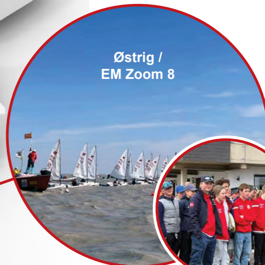
Østrig / EM Zoom 8