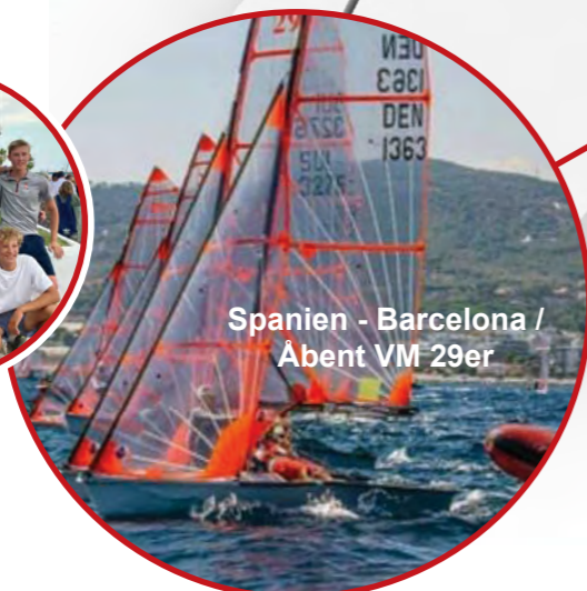
Spanien - Barcelona / Abent VM 29er