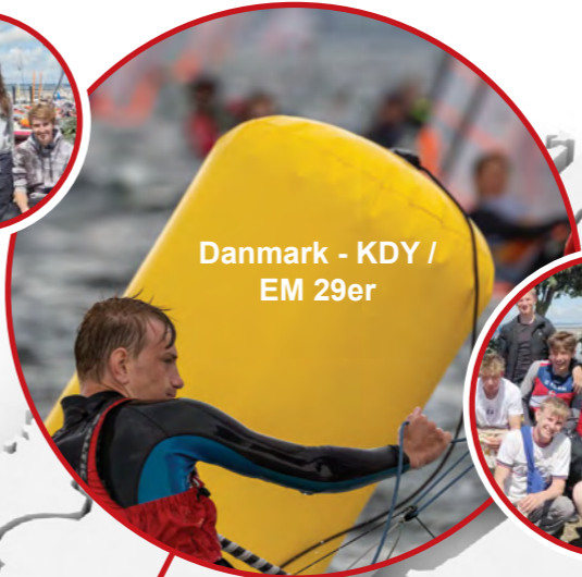
Danmark - KDY / EM 29er