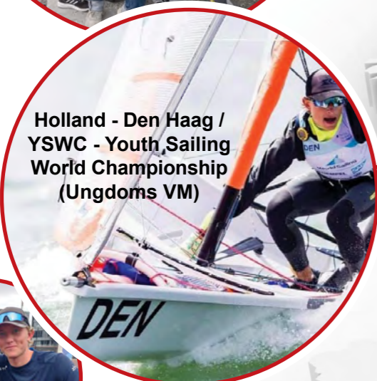
Holland - Den Haag / YSWC - Youth Sailing World Championship (Ungdoms VM)