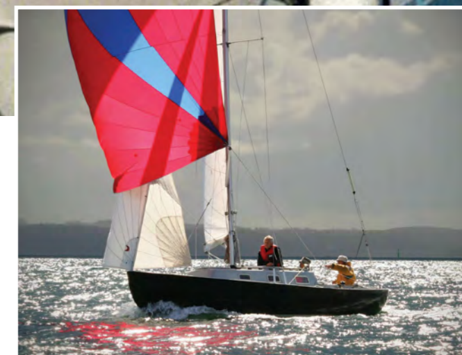
Spækhuggeren, en båd med masser af sejlerglæde.